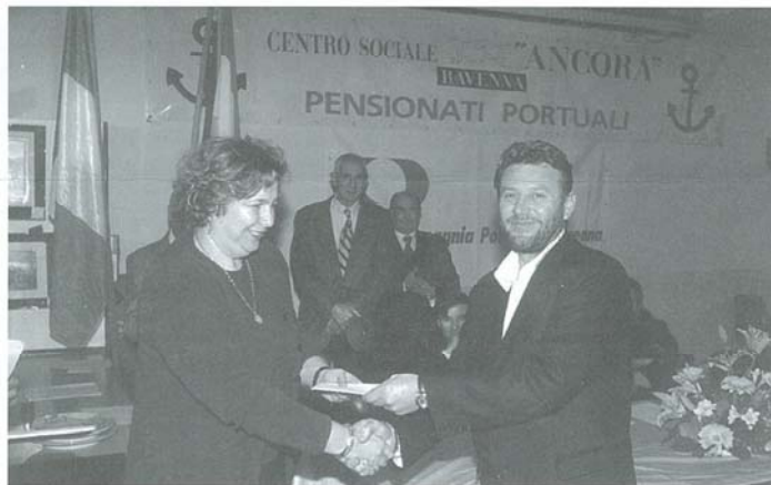
Pressi con la rappresentante della Casa Protetta Pallavicini Baronio