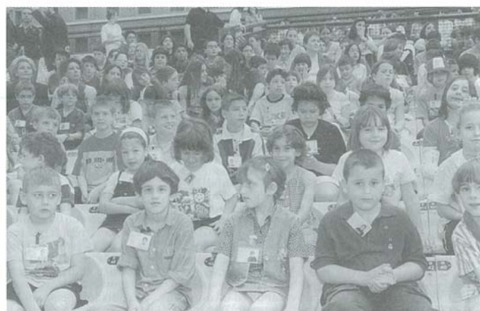
Oltre mille alunni hanno partecipato con i loro insegnanti alle premiazioni dei disegni.