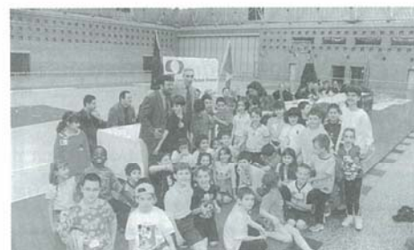
Foto di gruppo dei bimbi e delle insegnanti delle classi 2A e 2B della scuola elementare Randi.

dere l'utilizzo delle nuove tecnologie. Prendendo spunto dalle problematiche emerse durante l'organizzazione dell'iniziativa, il sindaco ha anche annunciato che 4 scuole elementari saranno dotate a breve di un apparecchio fax. Sono stati consegnati ai vincitori un primo, un secondo ed un terzo premio per i migliori disegni delle scuole elementari e medie, 16 premi