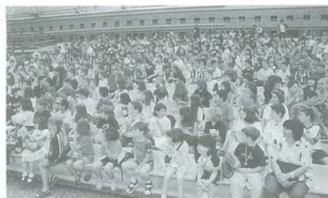
Gradinate affollate per la premiazione organizzata dalla Portuale.