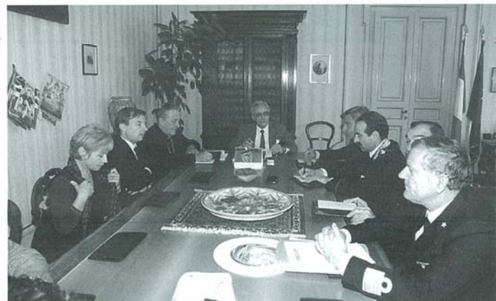
Una delle riunioni in Prefettura per risolvere il caso della Costinesti

che in Romania viene considerato il reato di 'abbandono della nave'. I marittimi sono tornati a casa grazie al contributo di Assindustria, Banca popolare e Fondazione Cassa di Risparmio di Ravenna. E' stato anche costituito un fondo a disposizione di marittimi in difficoltà. Se anche nel por-