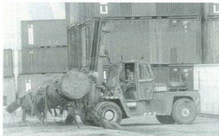
MOVIMENTO DI SBARCO E IMBARCO PORTO DI RAVENNA (TONN.)

L'insieme delle merci sbarcate ha raggiunto la quota record di 15.474.819 tonnellate con un saldo attivo di 1.913.445 tonnellate (+14,1%) sullo scorso anno e di 1.497.635 tonnellate (+10,7%) rispetto al 1992. All'aumento dell'11% dei prodotti petroliferi