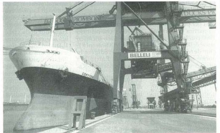
La Coryton, mentre viene sbarcata all'Eurodocks