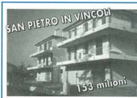
SAN PIETRO IN VINCOLI 133 milioni

Appartamento in palazzina di 10 unità al 2° piano, di 73 mq. composta da: soggiorno e angolo cottura, 1 letto, bagno, disimpegno, ampio balcone, possibilità di garage e cantina a parte