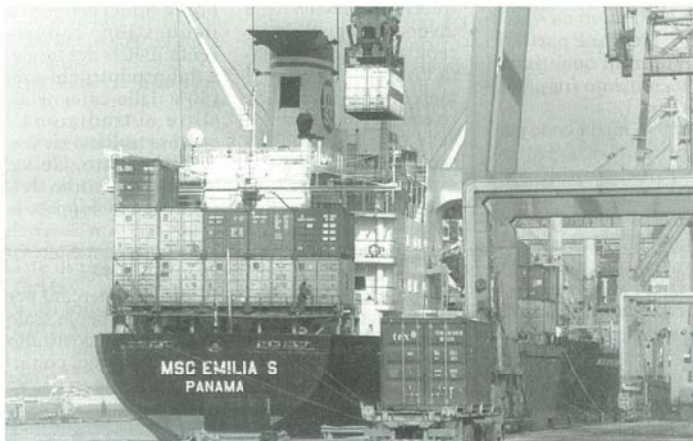
La Mediterranean Shipping Co. ha dato avvio alla nuova linea in partenza da Ravenna. I primi risultati a pag. 6