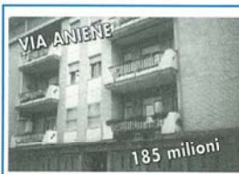
VIA ANIENE 185 milioni

Appartamento in palazzina di 10 unità al 2° piano, di 73 mq. composta da: soggiorno e angolo cottura, 1 letto, bagno, disimpegno, ampio balcone, possibilità di garage e cantina a parte